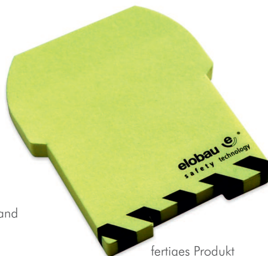
fertiges Produkt nach dem oben gezeigten Beispiel